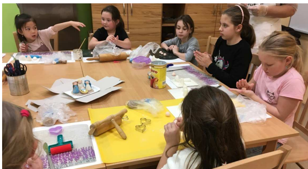
Projektový den ve školní družině – výroba marcipánových figurek