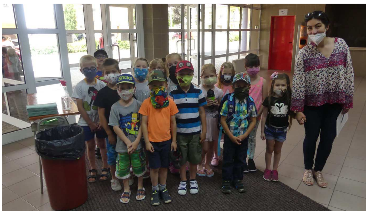
Budoucí 1. C

Slavnostní ukončení povinné docházky žáků 9. ročníku nakonec mohlo proběhnout, i když v omezenější a skromnější podobě. Čtyři třídy se rozdělily do 2 skupin a za přítomnosti svých rodičů a pedagogů si připravily důstojný program.