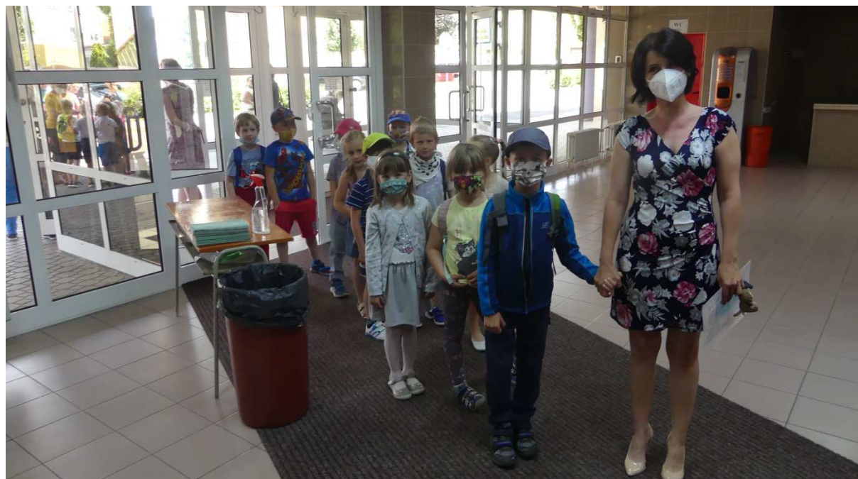
Příchod budoucích žáků 1. A do Nulté školičky

Za spolupráce rodičů se podařilo také setkání budoucích prvňáčků v Nulté školičce. Všichni měli povinné roušky, ale i tak si své seznámení se školou užili.