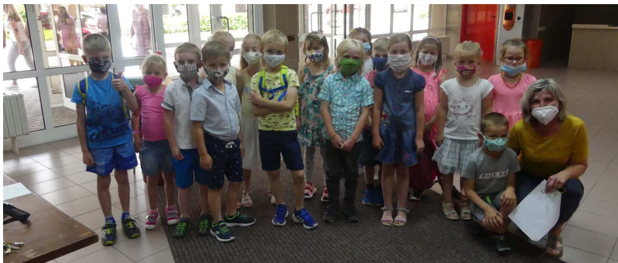
Budoucí 1. B