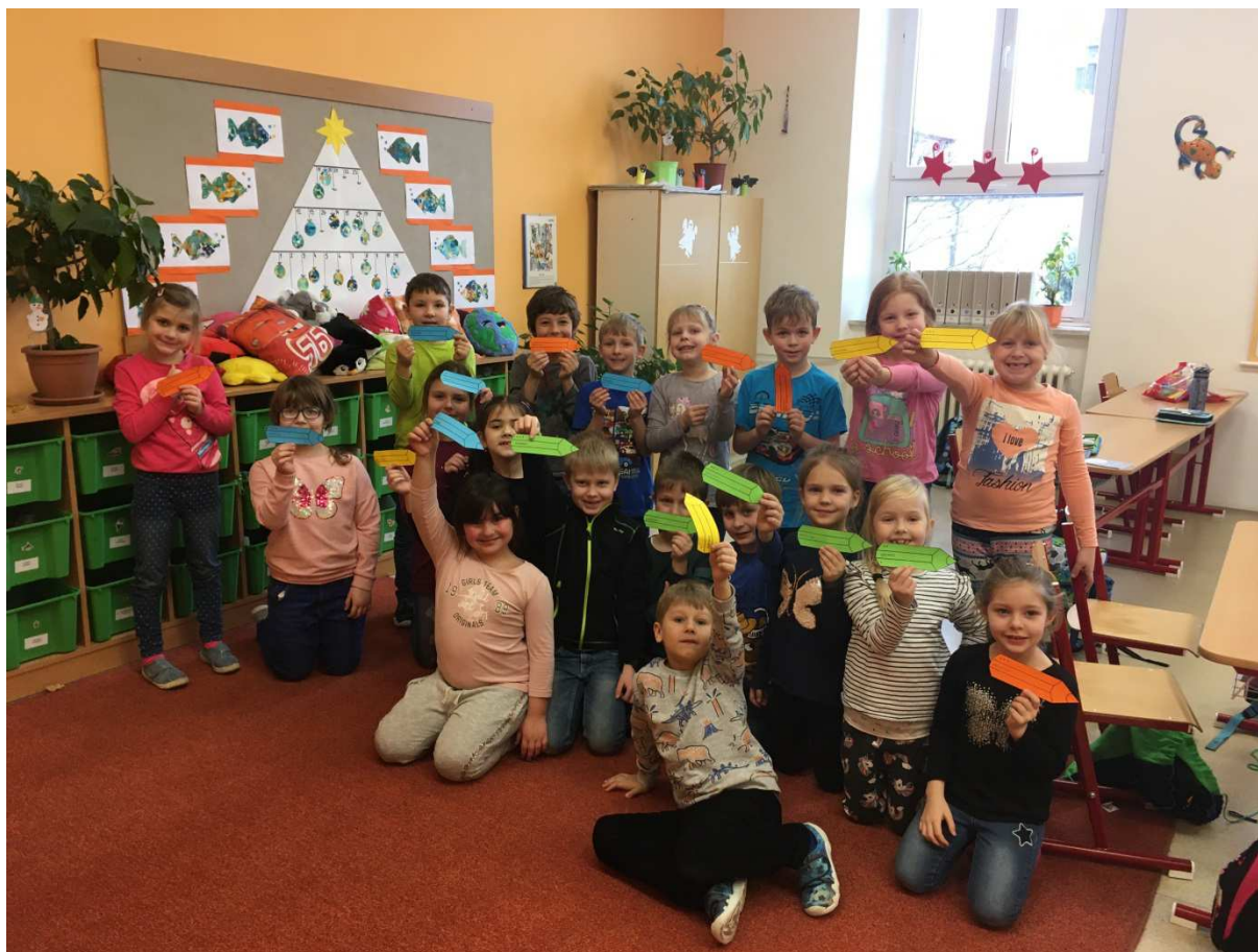
Výuka hrou v 1. B – ukázka, co všechno již umíme