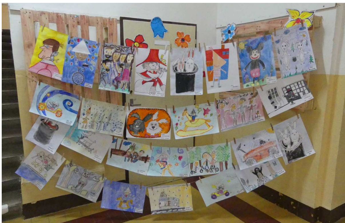
Vydařené obrázky soutěže o Družinového malíře