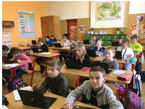
Projektový den a práce s tablety ve 4. B