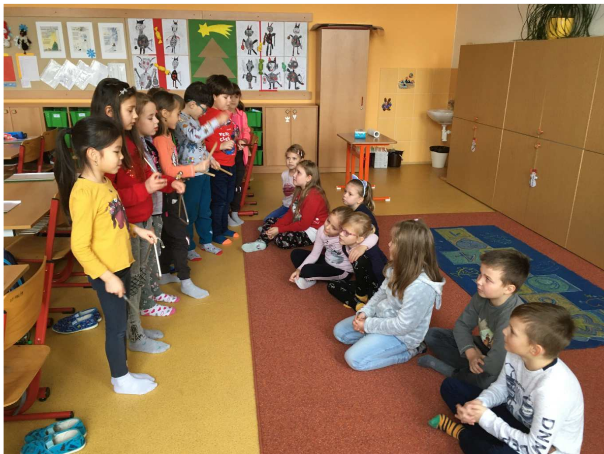
Výuka hrou v 1. A – hudební výchova

Škola si drží stabilní počty žáků mnoho let po sobě. V poslední době však stoupá zájem rodičů a roste počet tříd především na 2. stupni. Přicházejí žáci z okolních malotřídních škol nebo nově přistěhovaní.