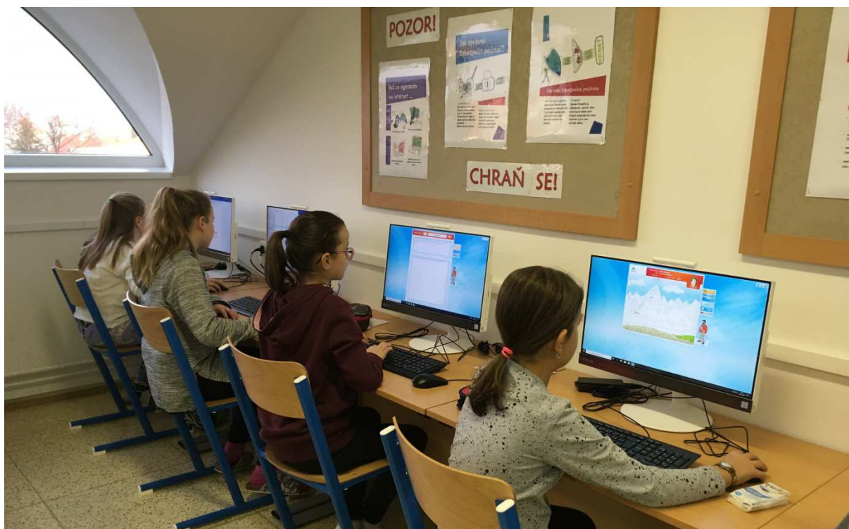
Výuka informatiky v 5. ročníku v nové učebně ICT: žáci v programu Mount Blue při nácviku psaní všemi deseti